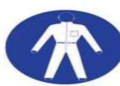
Vêtement de travail