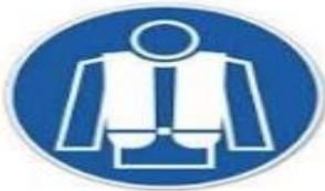
Gilet ou blouson réfléchissant