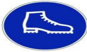
Chaussures de sécurité